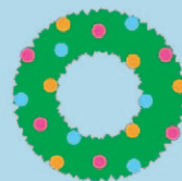
*イラストはイメージです