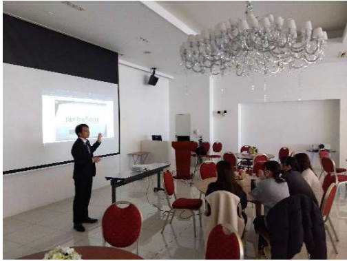
レストランサービス