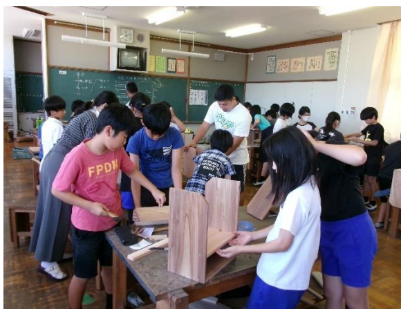
建築大工 (引き戸付き本棚作り)