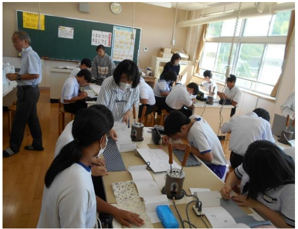
和裁 (ポケットティッシュカバー作り)