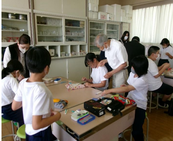
紳士服製造 (BOX ティッシュカバー作り)