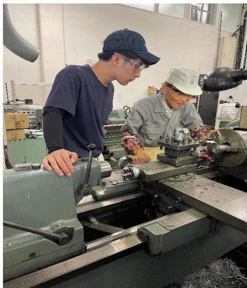
ダイトー工業株式会社 機械加工（旋盤）