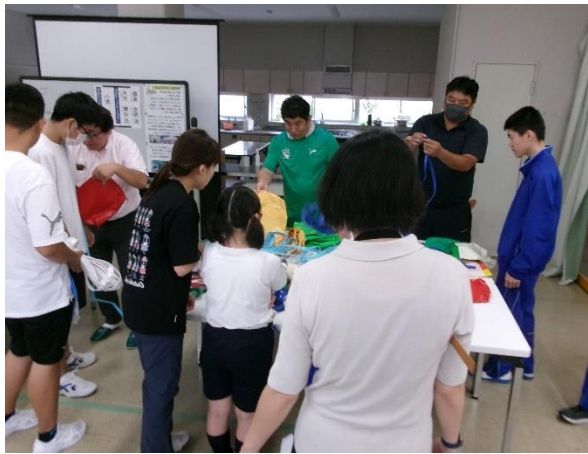
帆布製品製造 (トートバッグ作り)