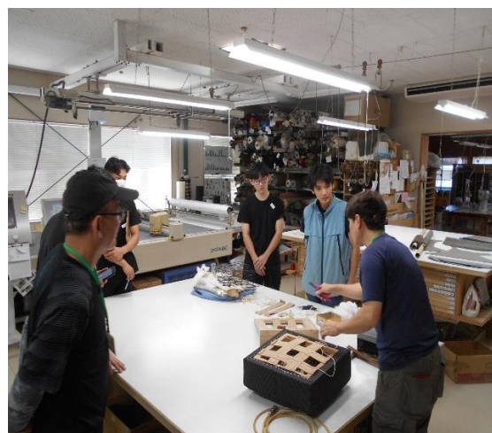
株式会社宮崎椅子製作所 家具製作（いす張り作業）