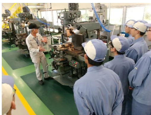
機械加工（フライス盤）