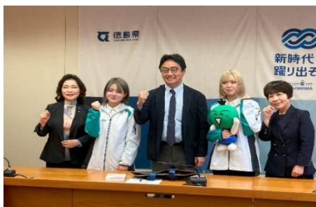
技能五輪全国大会壮行会