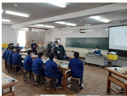
冷凍空調調和機器施工