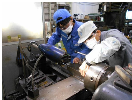
(株)東洋バルブ製造所での実技指導（普通旋盤）