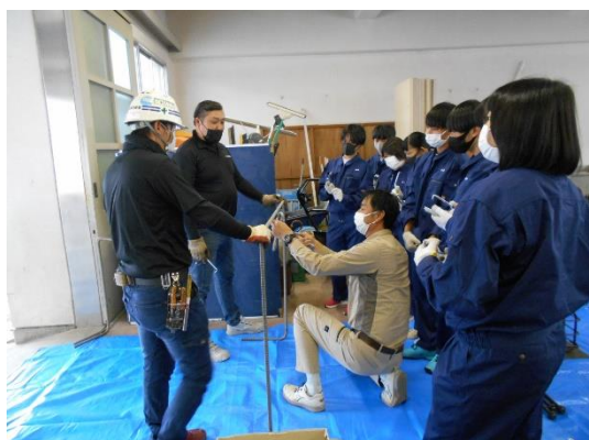
つるぎ高等学校（鉄筋施工）