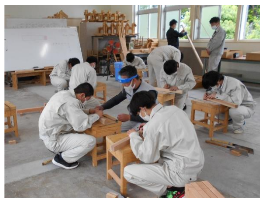
阿南光高等学校（建築大工）