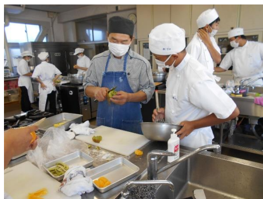
小松島西高等学校（洋菓子）