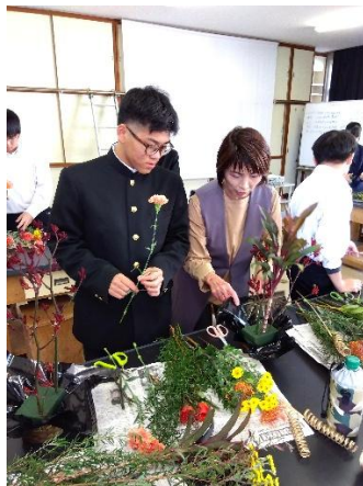
フラワー装飾職種