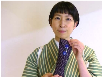
まずは簡単なペンケース