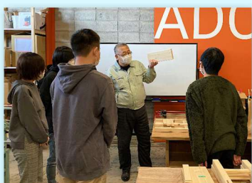
若者サポートステーションの利用者向け ものづくり体験 (家具製作職種)