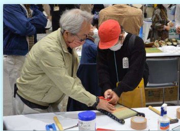
地域の参加型イベント ミニ畳製作 (畳製作職種)