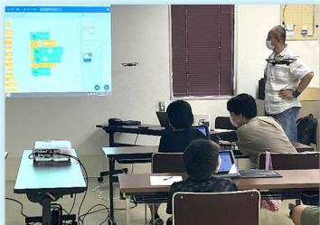
親子ドローン教室 (ロボットソフト組込職種)