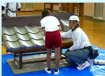
小学生による 架台に瓦を葺く作業 (かわらぶき職種)

地域の公民館で、小学3年生から6年生までの児童とその保護者を対象に、ドローンの概要や規制・安全面、プログラミングの考え方についての講話と、プログラミングの基礎練習を行い、実際にプログラミングでドローンを動かす体験を実施。